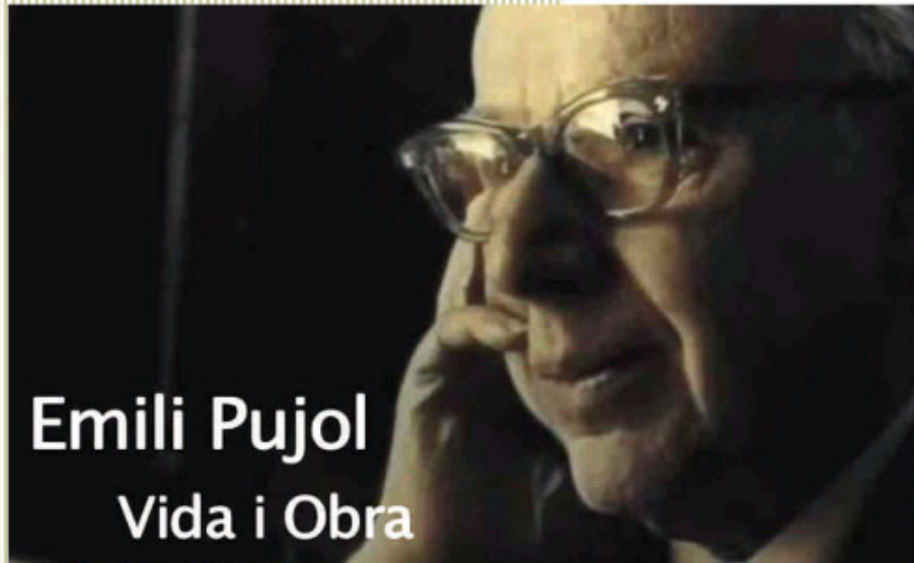
Emili Pujol Vida i Obra